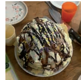
schon damit beschäftigt, alles vorzubereiten, unter anderem eine supertolle Pfannkuchentorte mit Erdbeeren, Bananen und Schokolade.