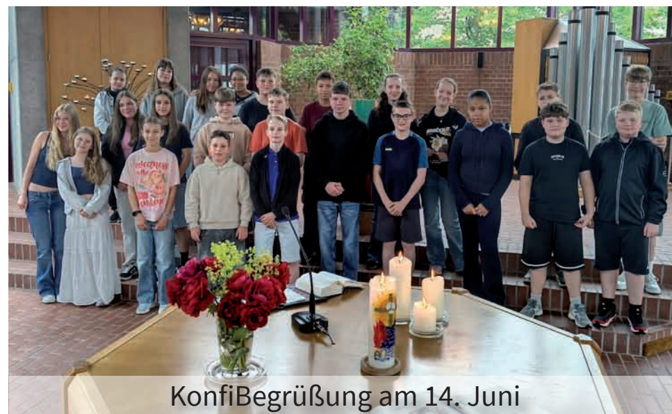
KonfiBegrüßung am 14. Juni

Das Ökumenische Zentrum neben der alten Bertolt-Brecht-Gesamtschule bildet den Abschluss und ist von allen Einrichtungen auch die jüngste, eingeweiht 1986/87. Dagegen sind alle anderen Kirchen aus den Anfangszeiten der jeweiligen Quartiere, überwiegend noch aus den 60er Jahren. Dabei sind Namen bekannter Architekten, wie Freiherr von